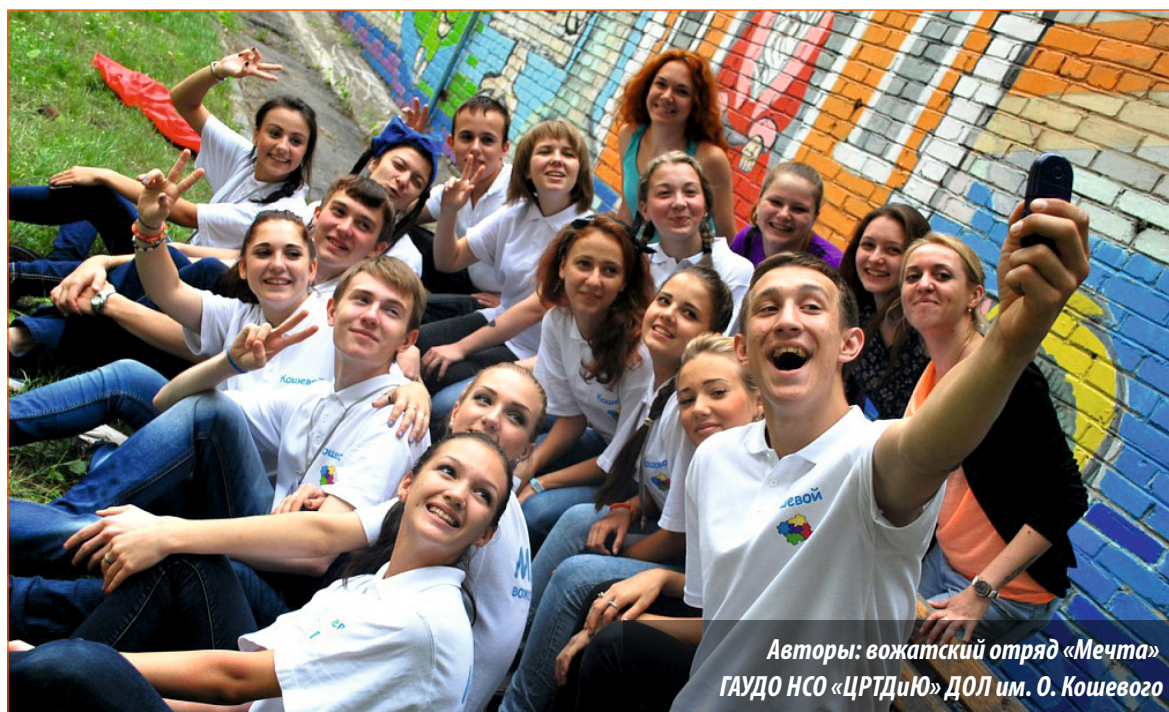
Авторы: вожатский отряд «Мечта» ГАОУ НСО «ЦРТДиЮ» ДОЛ им. О. Кошевого

1 локация – сцена. На сцене стоят декорации, включая стол с настольной лампой и стул с надписью «Режиссёр». Лампой освещаются листы сценария, в которых спрятано задание.